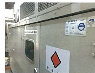
病棟用非常電源装置

当院でもより一層、身を引き締め、災害時避難訓練や非常電源装置の設置、各備蓄品等の確保に取り組んでまいります。