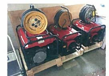
屋外用非常電源装置