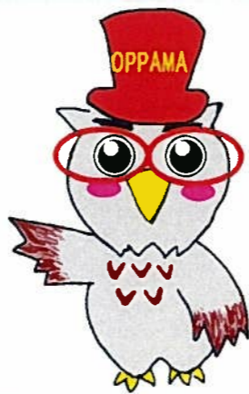
追浜地域包括支援センター マスコットキャラクター ほーぼー

追浜地域包括支援センターは、高齢者の介護をしているご家族の方からのご相談にのり、虐待をしないですむように支援しております。お気軽にご相談ください。