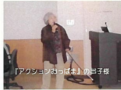
『アクションおっばま』の昌子様

地域包括的ケア会議とは、《地域包括ケアシステム》という、地域で高齢者がよりよく住めるための仕組みをつくるために、皆で話し合う場のことです。地域の課題について皆で話し合い、地域に関わる方同士のつながりをつくることもケア会議の目的の一つです。