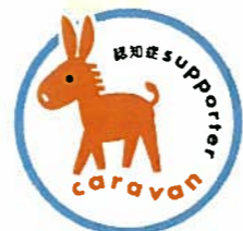
認知症サポーターキャラバン

※「認知症サポーター養成講座」へのお問い合わせ 追浜地域包括支援センター 046-865-5450