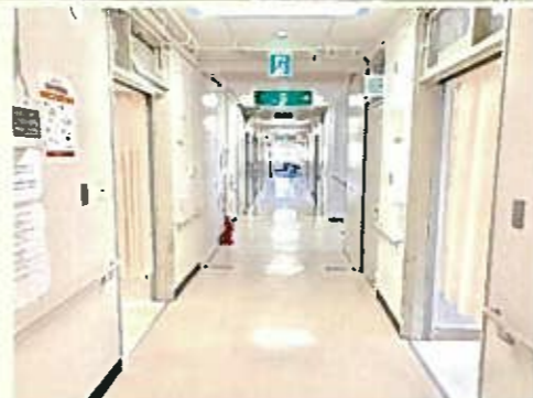
【地域包括ケア病棟イメージ図】

患者様の病状や必要に応じて、地域包括ケア病棟（西病棟）に直接入院する場合と、一般病棟（東病棟）を経て転棟する場合があります。地域包括ケア病棟は最長60日以内での退院が原則となります。入院費用は、年齢によりますが、ほとんどの方が一般病棟での入院費と変わりません。